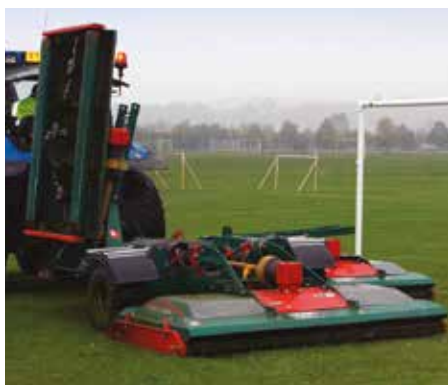
RMX 560 plié pour le transport. Repliage hydraulique.