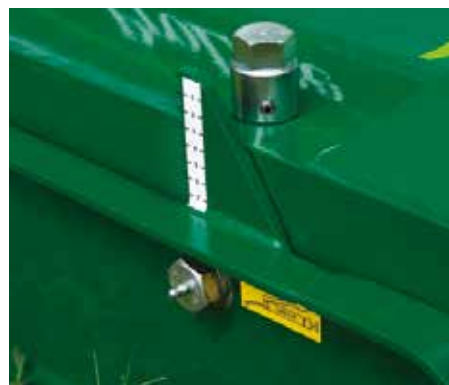
Système de réglage de hauteur de coupe simple.