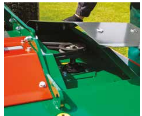
Entretien : facilité d'accès aux courroies.