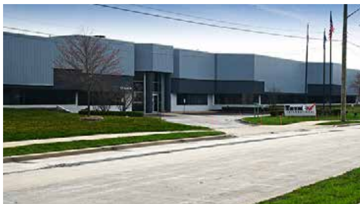
Les locaux Snowex dans le Michigan aux ÉTATS-UNIS

Avec la législation croissante en matière de santé et de sécurité exigeant le contrôle de la glace et de la neige, nous pouvons vous offrir la tranquillité d'esprit avec un épandeur SNOWEX .