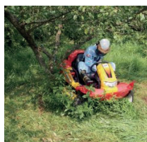
Assise basse pour une meilleure sécurité