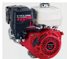
HONDA GX390 avec filtre à air cyclone