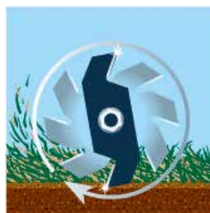
Après 60 heures