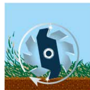
Après 90 heures