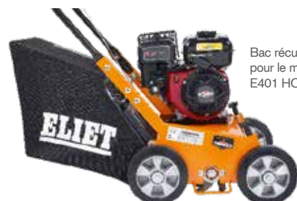
Bac récupérateur de série pour le modèle E401 HONDA.