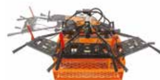
Guidon à réglage latéral.

Le rouleau frontal émiette, la herse frontale affine, la herse arrière recouvre juste après le semis et le rouleau arrière plombe.