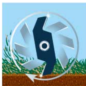
Après 30 heures...