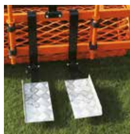
Option : marche-pieds. Réf : 1158300