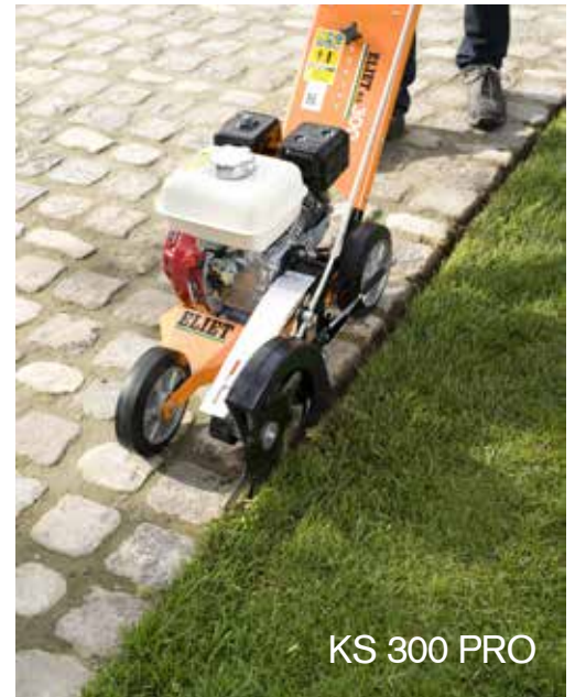
KS 300 PRO

Kit 4e roue (en option) pour apporter encore plus de stabilité machine.