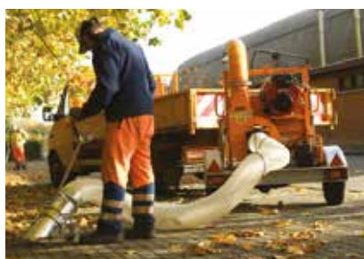
Version HD disponible sur remorque en option.