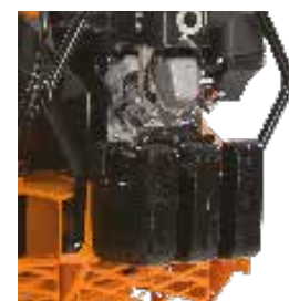
Option : masses. Réf : 1158200